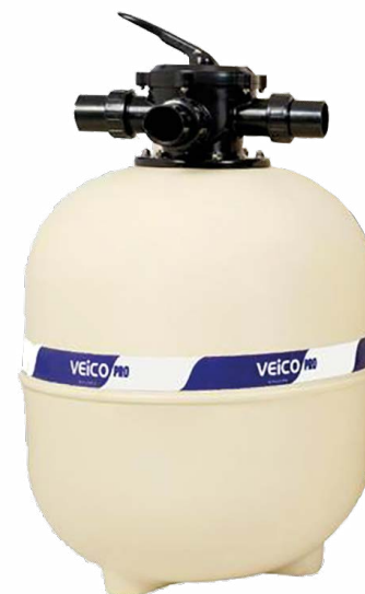
Filtro VEICO PRO