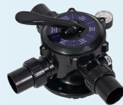
Válvula incluida Código: 131121