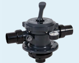
Válvula incluida Código: 131154