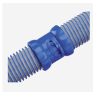
Mangueras Twist Lock