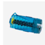
Medidor de caudal